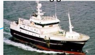
Vonar Autoline og garn