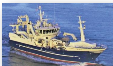
Hovden Viking Snurrevad og kystnot