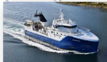
Gadus Neptun Bunntrål og reke-trål