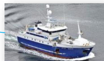
Nesbakk Autoline og garn