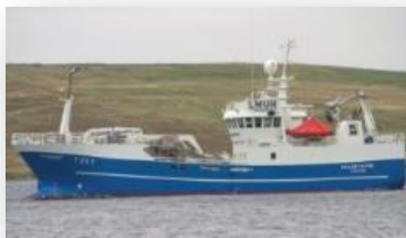
Skagøysund Snurrevad og kystnot