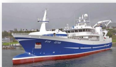
Cetus Industritrål og pelagisk trål