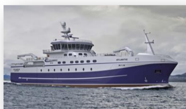
Atlantic Autoline, snurrevad