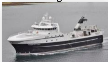
Havbryn Bunntrål og reke-trål