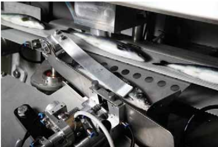
Figur 5. Detalj fra Maskon AS hvor en fettfinneklipper kan tenkes installert ( www.maskon.no ).

http://www.maskon.no/ og http://www.nmt.us/products/afs/afs.shtml ).